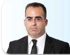
מאת: עו"ד רפאל יולזרי שותף, מחלקת ליטיגציה